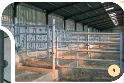
La partie de gauche est découpée en 6 box pour les génisses, puis en box à veaux.