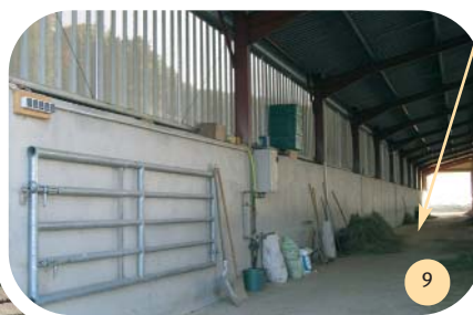
Zone de chargement dans le couloir arrière. Coin pharmacie et point d'eau.