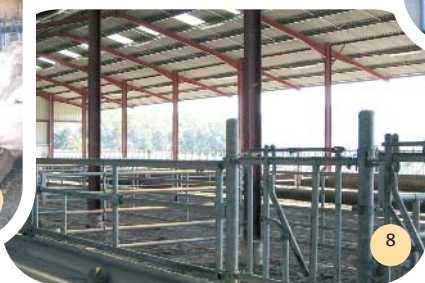
Barre au garrot et passage d'homme.