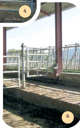
La stalle est surélevée de 0,40 m, il y a une petite butée de recul.