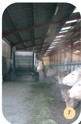
Distribution mécanisée d'ensilage de maïs et d'herbe enrubannée.