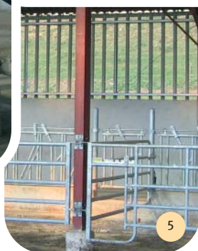
Passage à veaux.