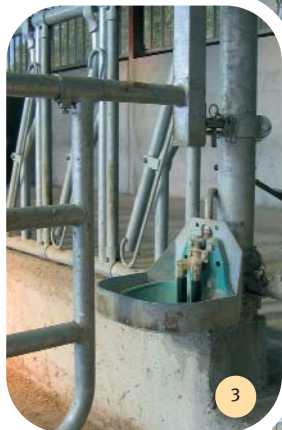
Abreuvoirs automatiques : bols doubles, dispositif antigel avec circulateur.