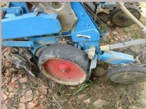
Le monosem NG 7 rangs